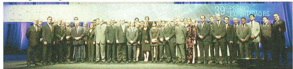
Na noite que comemorou o sucesso dos exportadores gaúchos, 24 empresas que se destacaram no comércio internacional foram premiadas em oito categorias

Empresas exportadoras que se destacaram em oito categorias, selecionadas pelo Conselho do Prêmio Exportação RS, receberam troféu em noite de festa nesta segunda-feira (20). A ADDVB também prestou homenagem ao presidente do Banco Central, Alexandre Tombini.